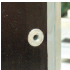
Rivets coniques têtes fraisées