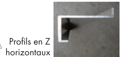
Profils en Z horizontaux