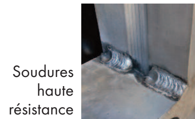
Soudures haute résistance