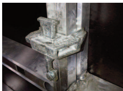
Bloc de jonction auto alignent