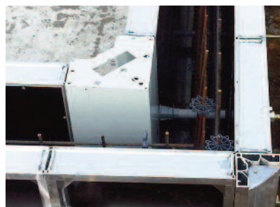
Angle ALU INTERIEUR monobloc