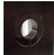
Bagues CP 15mm PVC choc de passage de tige.