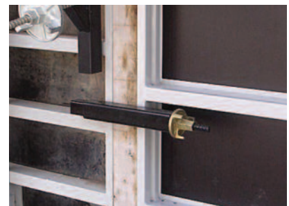
Bloc réglable de 0 à 15cm