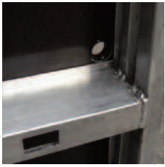
Lucarne de fixation de console