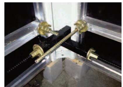
Bloc variable réglable à fourrure