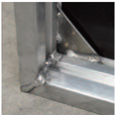
Renforts des angles par goussets 80x80 ép.5mm