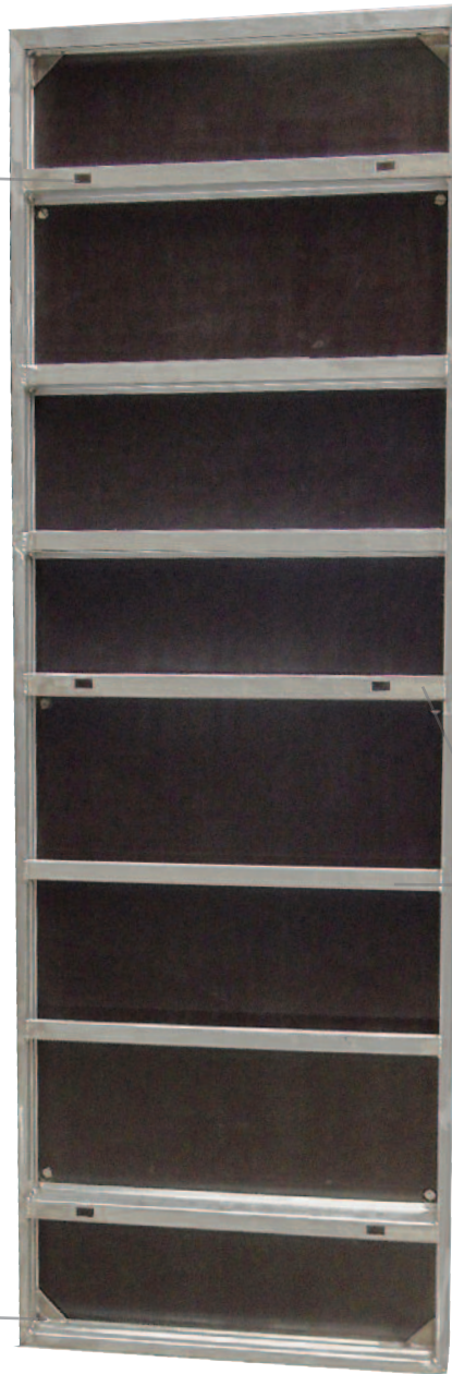
Renforts des angles par goussets 80x80 ép.5mm